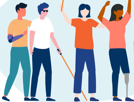
Illustration personnages : @freepik

entreprises partenaires du Réseau Gesat dont 40% implantées en région